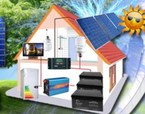
AC - 230 V