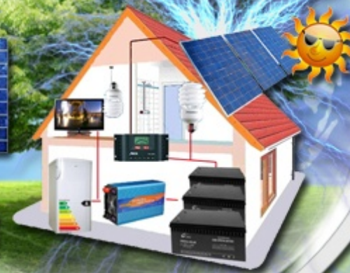
AC - 230 V