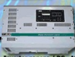
Invertor napona / DC - AC