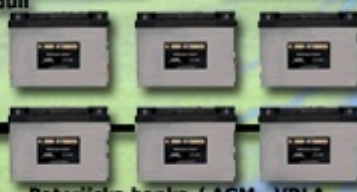
Baterijska banka / AGM - VRLA